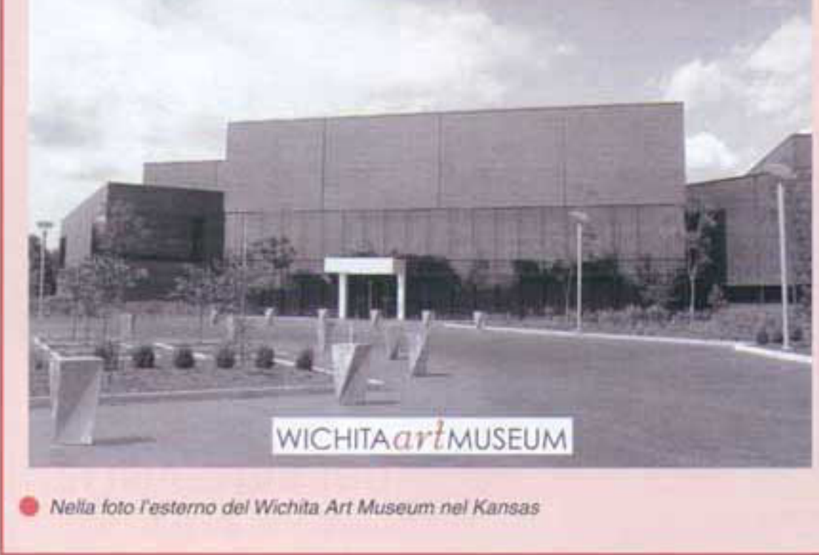
Nella foto l'esterno del Wichita Art Museum nel Kansas

La collezione "itinerante" pecciolese in mostra fino al gennaio 2004