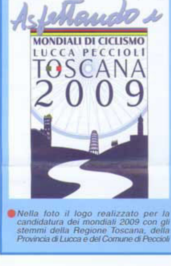
Nella foto il logo realizzato per la candidatura dei mondiali 2009 con gli stemmi della Regione Toscana, della Provincia di Lucca e del Comune di Peccioli

Firmato un importante accordo tra la Regione Toscana, la Provincia di Lucca e il Comune di Peccioli