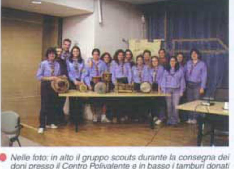
Nelle foto: in alto il gruppo scouts durante la consegna dei doni presso il Centro Polivalente e in basso i tamburi donati dagli amici africani

Gli Scouts al Centro Polivalente ricevono doni speciali tra suoni e ricordi